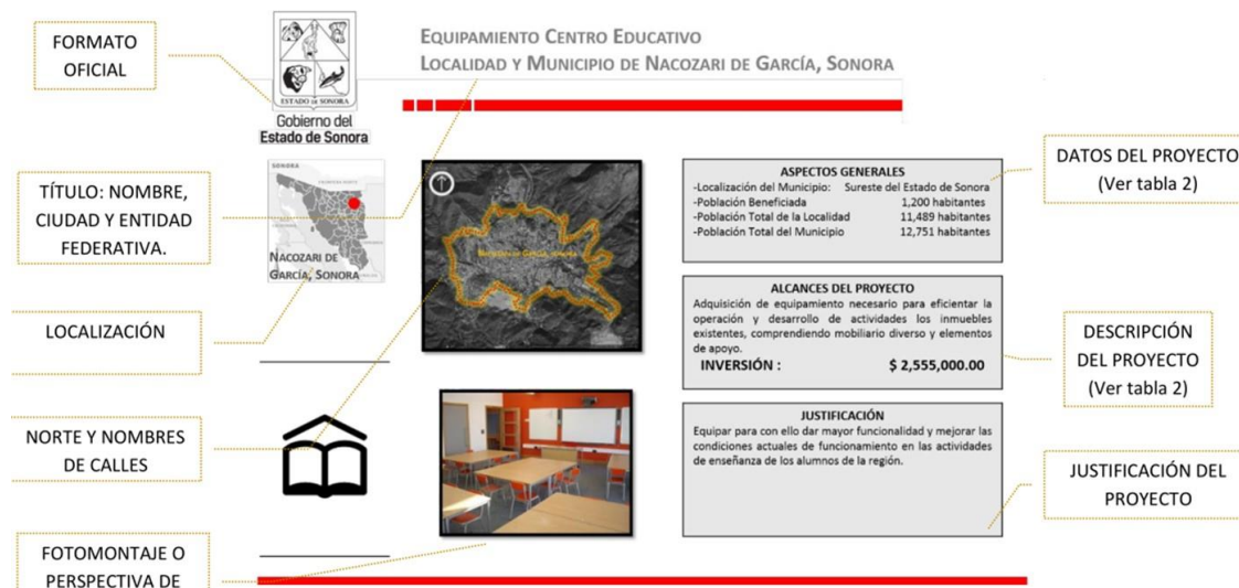
Imagen 2. Ejemplo de Ficha Técnica Gráfica de Edificación